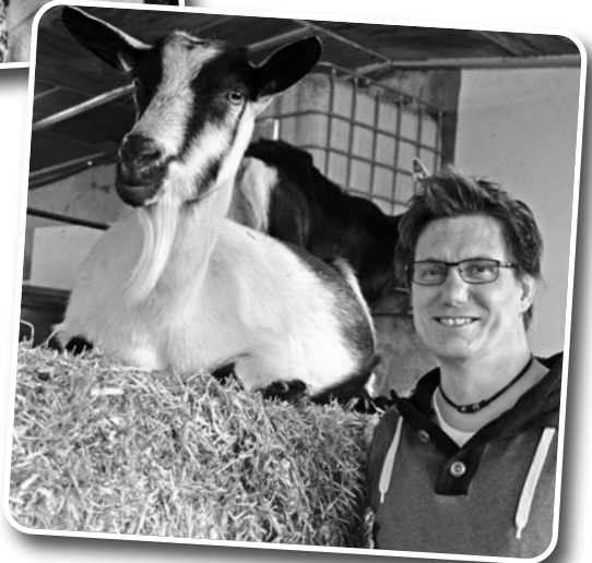
Rini Collenberg Technik, Licht und Bühnenbau – das schleckt keine Geiss weg!